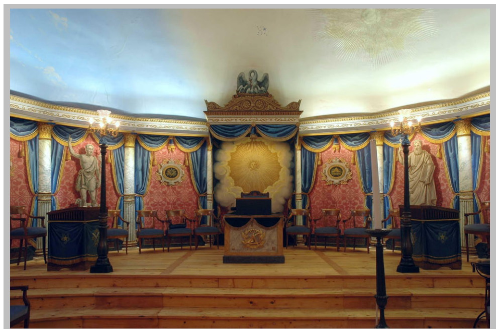
Loge L'Amitié – LA Chaux-de-Fonds © Michel Muttner restaurateur d'art – Le Landeron

swiss society of engineers and architects