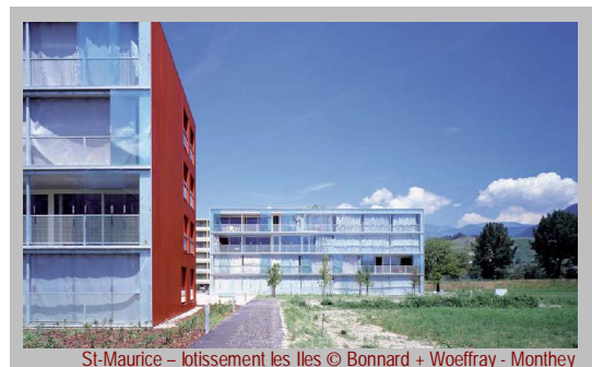
St-Maurice – lotissement les Iles © Bonnard + Woeffray - Monthey

« Logements collectifs les Iles à St-Maurice ».