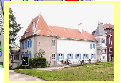
rue de la Loge 8

schweizerischer ingenieur- und architektenverein