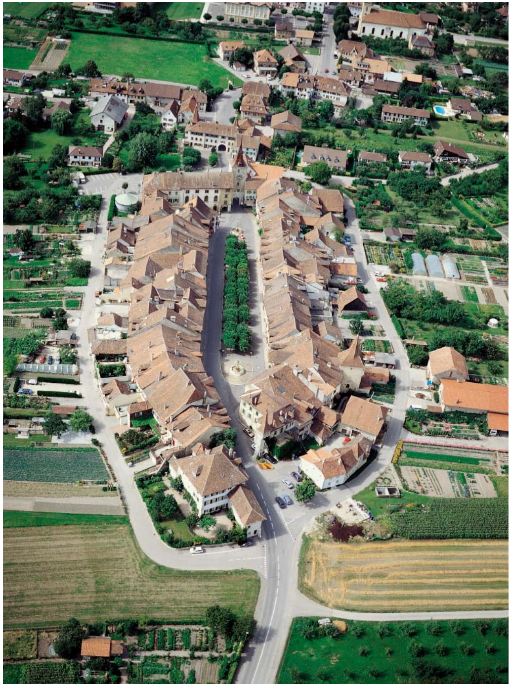
Photo du bourg du Landeron

swiss society of engineers and architects